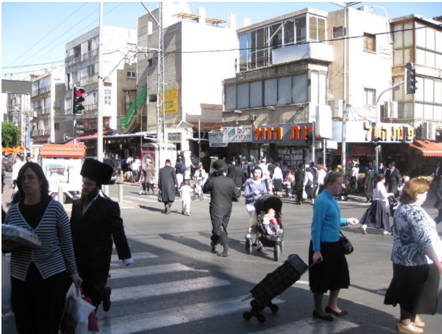
רחוב רבי עקיבא בבני ברק בימים כתיקונם. "בין הלקחים הרבים שצריך להפיק מההתמודדות עם מגפת הקורונה בישראל נמצאות ההשלכות על אסטרטגיית הדיור אם ישראל תמשיך במגמת הילודה הגבוהה, ותהפוך למדינה הצפופה במערב"

בין הלקחים הרבים שצריך להפיק מההתמודדות עם מגפת הקורונה בישראל נמצאות ההשלכות על אסטרטגיית הדיור אם ישראל תמשיך במגמת הילודה הגבוהה, ותהפוך למדינה הצפופה במערב. האידיאולוגיה המקובלת בתנוון סביבתי ובקרב חסידי העירוניות היא לעודד אנשים להתגורר בערים צפופות לאור היתרונות הסביבתיים הרבים, בין היתר בשל הפחתת הלחצים על משאבי כדור הארץ והשטחים הפתוחים. דומה שיש בתפיסה זו היגיון רב. עם זאת, אחת ההשלכות של הממצאים במחקר זה היא שבכדור הארץ שהולך ומצטופף, ייתכן שאין זה מספיק שבני אדם ישנו את דפוסי הדיור. הפחתת מספר האנשים החולקים את אותה סביבה עירונית כדי לצמצם את צפיפות האוכלוסין צריכה להיכלל כנושא שאפשר לדון בו במסגרת הפקת לקחי המגפה ויישומם בעולם ובישראל.